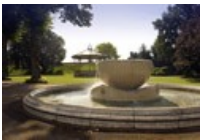
Rupert Bear Museum

Dane Jon park in the summer has a number of special markets and events on as well as the children's maze